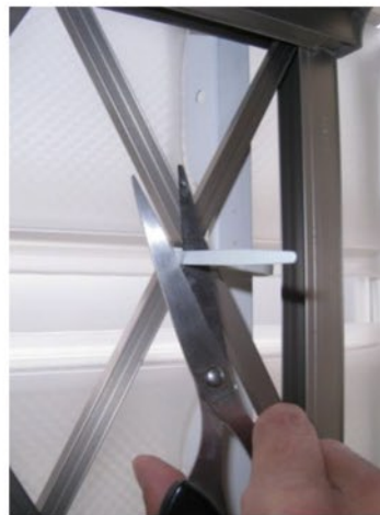
⑧ ⑤～⑦を繰り返すすべての箇所を仮止めした後、均等に本締めし、余分な部分をカットします。