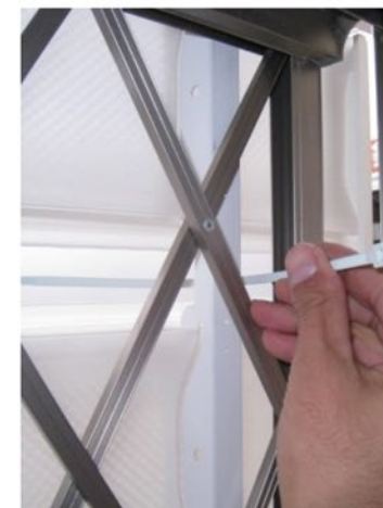
⑤取付位置へバンドを通します