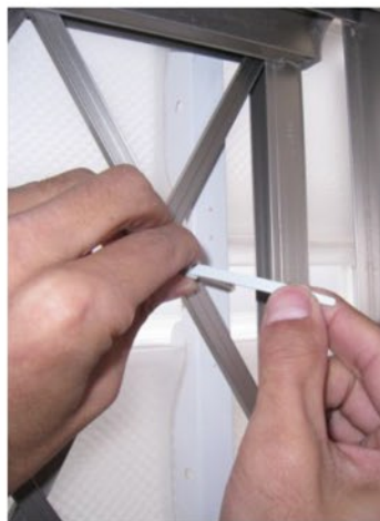
⑦差し込んだ先を引張り、軽く締め込みます。 ※一度に締めると製品が動く場合があります