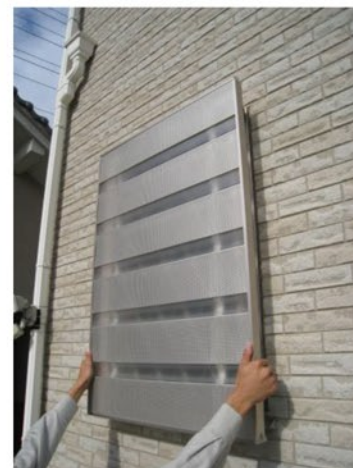
④室内側の方が取付バンドを固定するまで表側の方が押さえておきます (万一の落下予防)